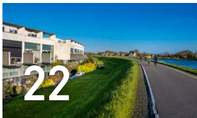
Een groen Capelle