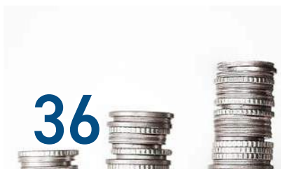
Financiën, deelnemingen en verbonden partijen