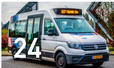
Een bereikbaar Capelle