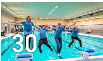
Een sportief en recreatief Capelle