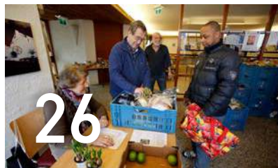
Een sociaal en zorgzaam Capelle